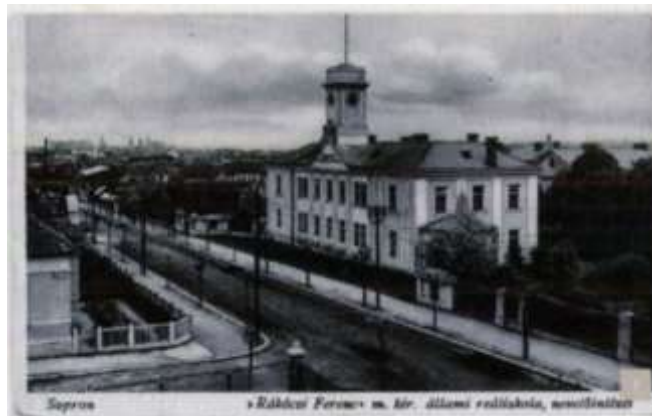
A Károly-laktanya parancsnoki épülete