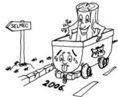
2006. évi csille- és rönktolás logója