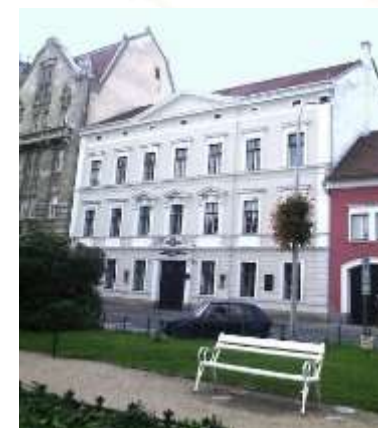
A bencés gimnázium és az evangelikus líceum Sopronban