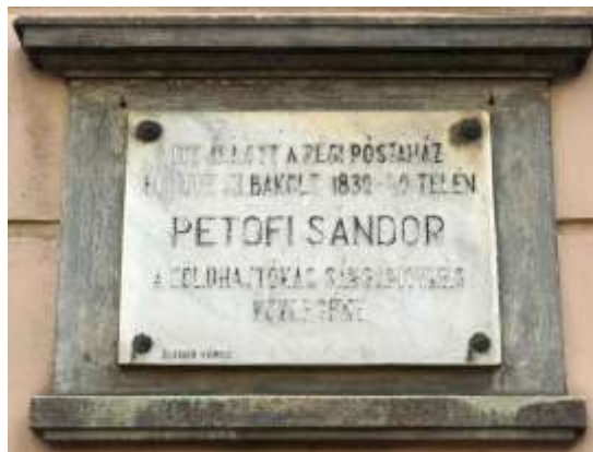
Petőfi emléktábla az Újhelyi-ház falán Sopronban.