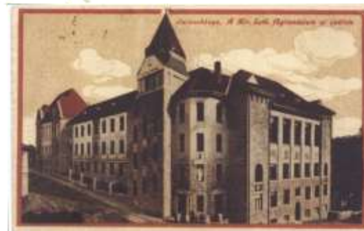
Az evangelikus líceum és a katolikus főgimnázium Selmecebányán