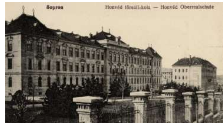
A honvéd főreáliskola épülete