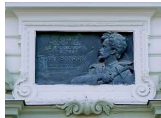
Petőfi emléktábla a soproni Petőfi Sándor Általános Iskola falán