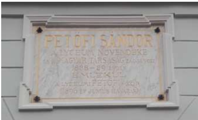
Petőfi emléktábla a selmeci líceum falán

1841-ben mindkét városban megfordult: Sopronban obsitért, Selmecen bizonyítványa kikérése ügyében