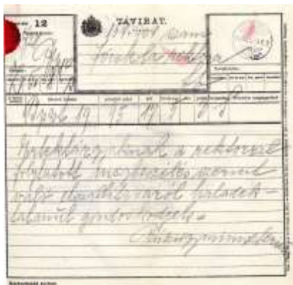
A Pénzügyminisztérium rendelete 1918.12.05. Forrás: SOE KL 1.c.

1922.02.20. a Honvéd Főreáliskola épületeinek hivatalos átvétele.