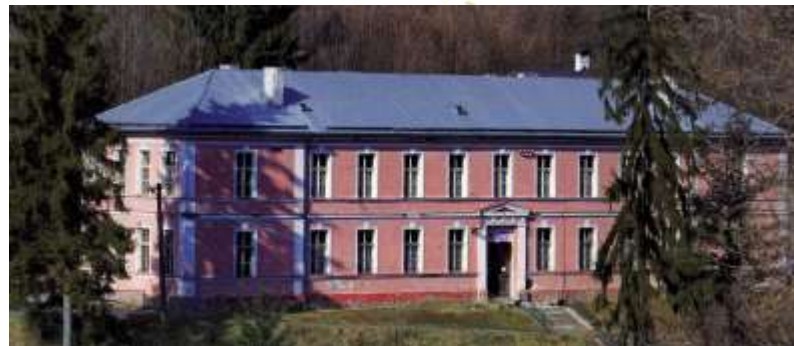
Az evangélikus tanítóképző épülete Selmecebányán